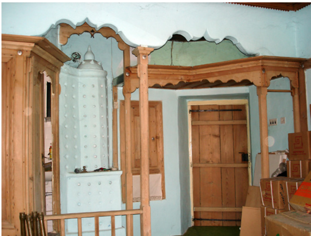
13. Кућа Адем аге Ђона, детаљ ентеријера улазног дела собе (оде)