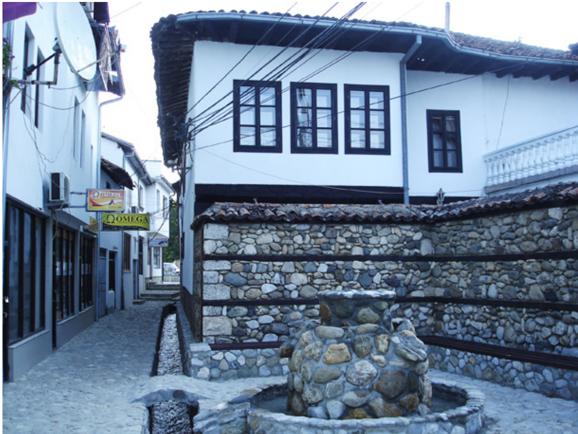
3. Махала и „сокак улица“ око Бајракли џамије из турског периода

у периоду потпадања ових области под турску власт. Разлог томе је српско властелинско порекло бројних призренских градских породица. 9 Симболично, мењају се само спољашна обележја и вера, док архитектура кућа остаје иста. Зидари православне вере из ове жупе и даље су пожељни као градитељи бројних беговских, агинских и шеховских кућа у Призрену.