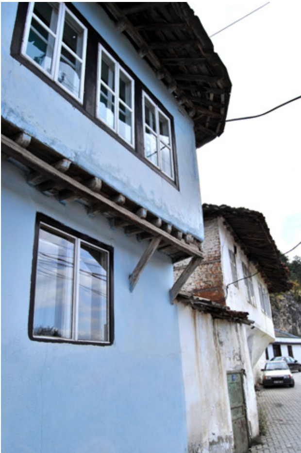
4. Градске куће у Мараи махали

на, показао је невероватне елементе урбане и одбранбене прилагодљивости и отпора саме махале према овим процесима. Спољашње формирање затворених махалских блокова било је помоћу спољних фасада самих кућа, а веома ретко помоћу високих додатних зидова. Увек је постојао веома ограничен број спољних улаза који се могу лако контролисати. Оваква дефанзивна природа Призренске урбане архитектуре дошла је до свог изражаја у периоду од XV до XVII века у том интензивном и силовитом притиску појединих паша да верски промене структуру појединих Призренских махала. Е у том периоду настала је ова специфична урбана реакција и одбрана путем саме куће и урбане заједнице-махале према самом непосредном окружељу. Та реакција је довела до малих врата (званих капицик) унутар зидова који окружују двориште и пружајући тајну комуникацију између једне куће и друге, и дакле, она та мала врата постају отвор за евакуацију у опасном тренутку али и омогућавају становницима да се тајно састају или за неку другу сврху. Овај приказ настанка и еволуције Призренских равничарских блокова који ће временом сви постати турски постаће идејни обрасци за друге мале заједнице пре свега за Српску које ће користити исте ове урбане принципе у физичкој и архитектонској одбрани у