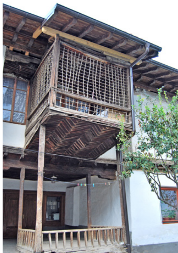
7. Кућа Шех Хасана (конач за госте Халвети текије) XVI- XV III век