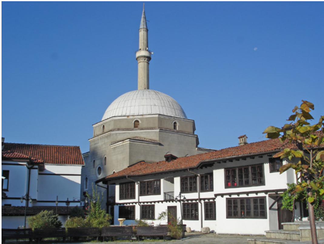
2. Монументална архитектура из отоманског периода-Мехмед пашина џамија

средњовековна српска држава и наслеђе које је она оставила на простору овога града. У вишевековном сталном развоју, укључујући и период турске владавине, град Призрен ће задржати своје карактеристике и још више ће их развити у области профане архитектуре. Призрен сачињавају махале са кућама које поседују високе вредности из домена архитектонског стваралаштва овог подручја које се ослања на наше средњовековно наслеђе и хетерогену националну структуру појединих од њих. Поред православних Срба, који су били најстарији становници града, постојале су још три етничке групе које су живеле у различитим деловима града, свака са својом карактеристичном верском и социјалном организацијом. Срби су, живели у централном-брдовитом делу, у Варош махали и у неким другим јужним деловима града. Влашка четврт је била концентрисана у посебном делу града који и данас постоји и познат је као „Поткаљаја“. Латинска четврт сеже у далеку прошлост и прожимала се у делу заједно са Српским махалама. Остали делови града - у равници припадали су муслиманском делу становништва који своје порекло води од Срба староседеоца, а који се исламизацијом претопио касније у Призренске Турке својим говором, обичајима и архитектуром. Ово истраживање износи претпоставку да је архитектура града резултат аутохтоних карактеристика саме средине где је настала, њене традиције, економских односа и делатности који-