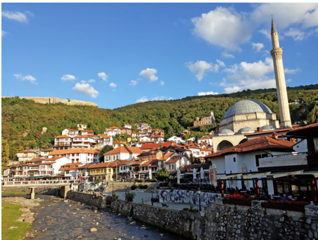
Призрен, панорама града

Кључне речи: Призрен, пример, архитектура, махала, палате, палата, образац, традиција