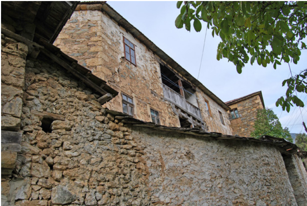
9. Кућа Совтића у Средачкој жупи као „мустру“ коју су разносили зидари из Средачке жупе

њених димензија, ширина од 21 метара, дубина 14 метара, корисним висинама приземља и спрата од прко 3. метара представља маркантан објекат који у себи носи елементе наше дворске архитектуре. Рекли смо да је Призрен град који је био у више наврата краљевска и царска престоница и самим тим поседовао пожељне „архитектонске обрасце“ модела материјализације оваквих објеката. Град је такође имао и своје Душановим Законом дефинисане градитеље који су у град долазили да граде ове палате и њему најближе Жупе, која је у овом случају Средачка жупа. Ти градитељи из те најближе жупе понудили су „мустру“ за решење архитектонског и функционалног модела двора која ће бити прихваћена од стране средње-вековних Српских краљева и царева а касније и од богатих турских ага и бегова. Кућа се развија на два нивоа: приземље и први спрат, и у својој основи има правилну правоугаону форму, што је једна од најбитнијих карактеристика „горње-вардарске“ куће. 22 Она је резултат примењених функционалних решења њених градитеља, средачких зидара, који су своје јединствено и више векова коришћено решење основе куће са дугим аксијалним ходником, аралаком вешто примењивали и