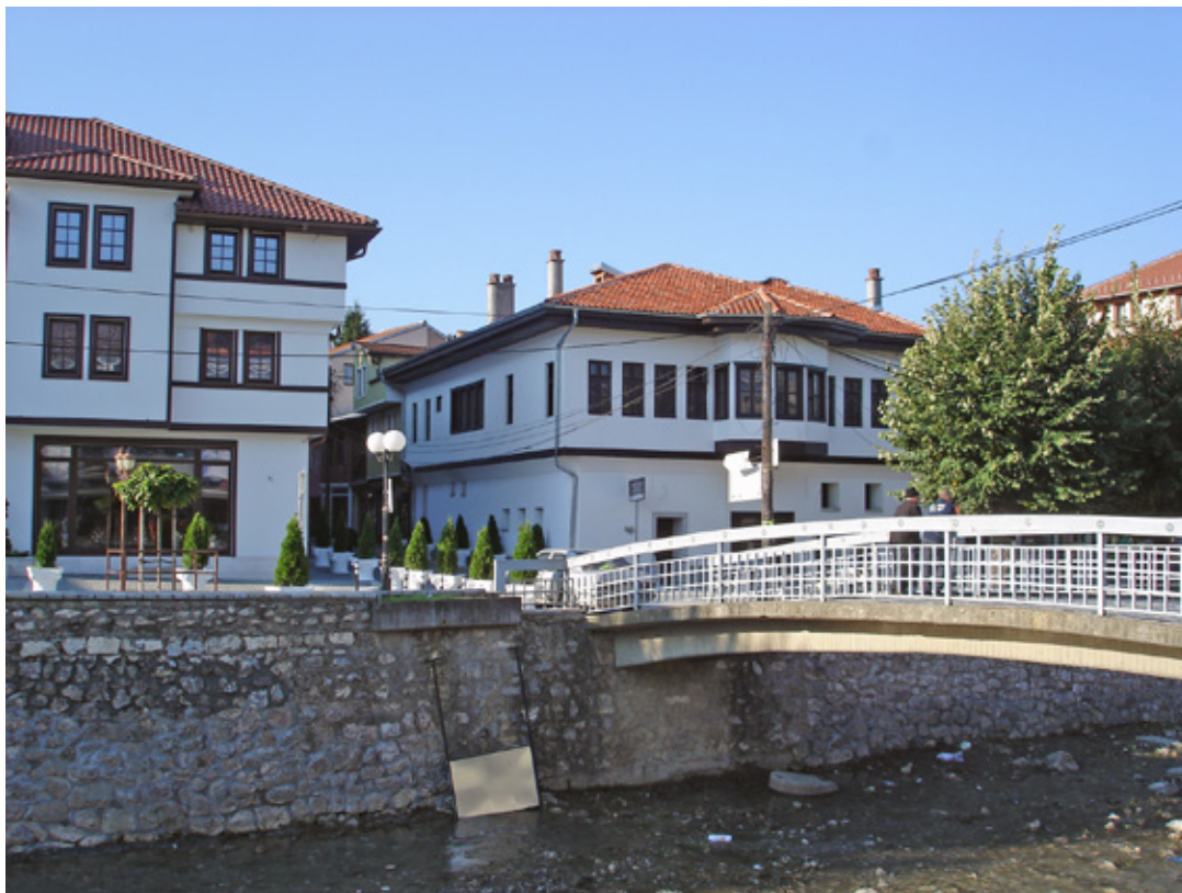
8. Кућа Шаун наше Перолија из XIX века