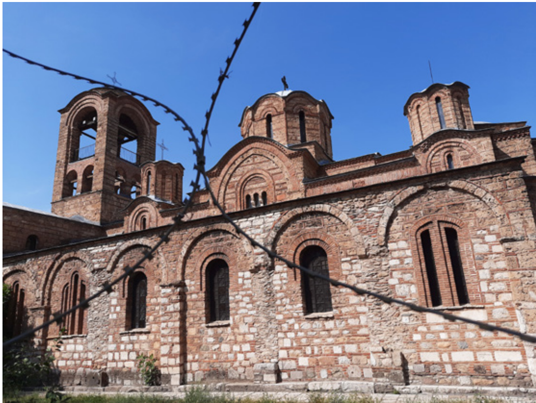
1. Монументална средњевековна црквена архитектура-Богородица Љевишка

ће остати све до 1912. године. Од мноштва објеката из отоманског периода посебно се својом архитектуром истичу Синан-пашина џамија, хамам Мехмед паше, камени мост, сат кула и бројне приватне палате 3 призренских паша, ага и бегова, које спадају у ред најлепших не само у Србији, већ и на Балкану. Те градске палате ће бити грађене по узорима и обрасцима из нашег средњевековног периода.