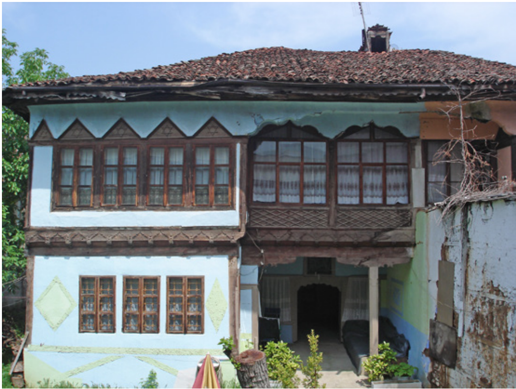
11. Кућа Адем аге Ђона а некада Рустем наше Ротула (стари сарај) из XVIII века

уграђивали у призренске палате, прилагођавајући га муслиманском становништву, тако да се аралак трансформише у санитарни блок са купатилима на спрату, а у приземљу користи се као мутвак за потребе кухиње. Приземна партија састоји се од куће, преткуће (ајат) и три собе и горе наведених просторија које су настале трансформацијом аралака. Улаз у собе где се налази врата омењан је њеним закошеном из више разлога, функционалног - због прегледности собе и хола конструктивног због укрштања конструкције. Једноставни састав приземља задовољава основне економске потребе домаћинства. Висина приземних просторија је око три метара. Преко једнокраких степеница стиже се на спрат, чардак и диванхану који обједињују четири стамбене просторије на овој етажи. Чардак-диванхана (затворени део) је моћан и својом јужном страном представља отворени део спратне просторне зидне завесе. Организација простора лака је и са прегледним је комуникацијама. Посебан квалитет у том смислу нуде пространа преткућа (ајат) и „краљевски“ чардак у укупној површини од скоро 90. квадратних метара који се у делу степеништа увлачи и формирају дискретну, прикривену везу екстеријера и ентеријера.